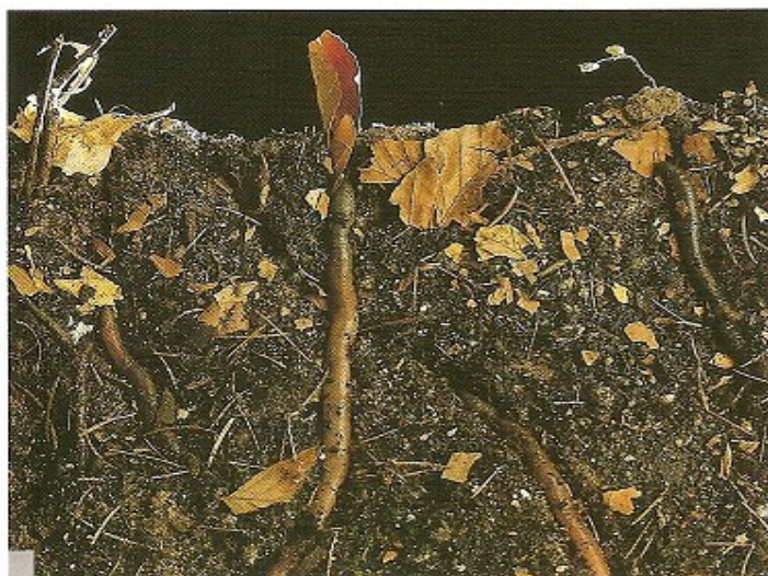
31 Coupe de sol avec Lombric.