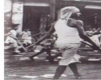
Document 6 : Les violences entre Hindous et musulmans au moment de l'indépendance.

Sur votre cahier répondez par des phrases complètes aux questions suivantes :