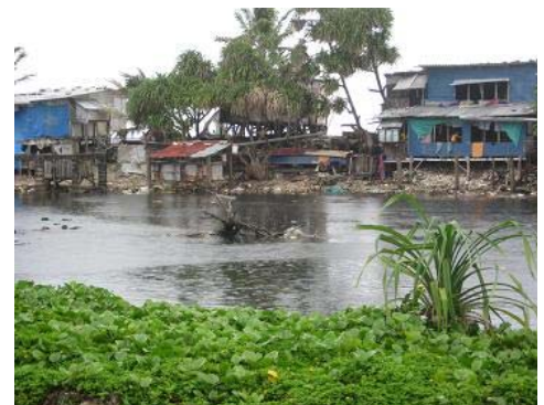
Inondation à Funafuti

Tuvalu ne dispose pas d'importantes ressources naturelles, hormis la pêche, et la majeure partie de sa population vit de l'agriculture de subsistance. La population salariée est employée dans l'administration à 70 %. Environ un millier de Tuvaluans sont employés comme marins, ce qui apporte une source de revenus importante au pays. Il existe d'ailleurs un Tuvalu Maritime Training Institute sur Funafuti. Tuvalu vit aussi d'un fond de placement, le Tuvalu Trust Fund , alimenté au départ par l'Australie, la Nouvelle-Zélande et le Royaume-Uni et dont les revenus couvrent 11 % de son budget. À cela, le pays rajoute des licences de pêche, la location d'un spot Internet (Tv), des ventes de timbres, sa voix pour Taiwan à l'ONU... Tuvalu est régulièrement exposé aux cyclones tropicaux. Il est également menacé par la montée du niveau des mers due au réchauffement climatique.