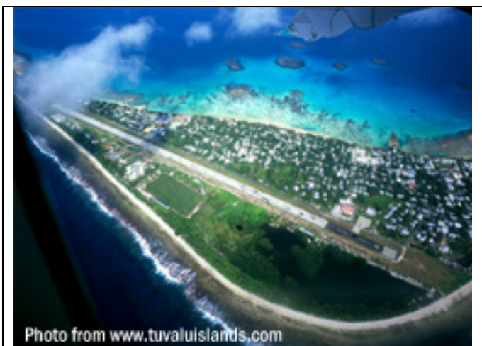
Des atolls surpeuplés...