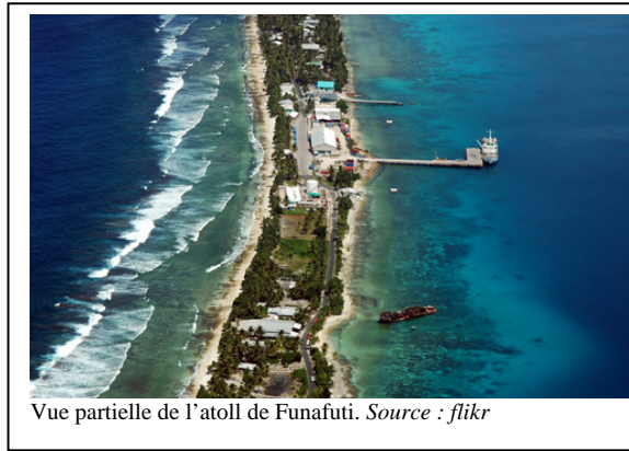
Vue partielle de l'atoll de Funafuti.

Type de gouvernement : Monarchie parlementaire (reconnait la reine d'Angleterre comme chef de l'État)