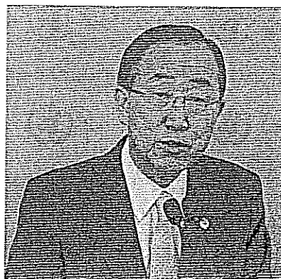
Le Secrétaire général de l'ONU, Ban Ki-moon

Le Secrétaire général « demande que les auteurs de cet acte lâche et haineux soient rapidement traduits en justice », ajoute le texte. Comme beaucoup de personnes à travers le monde, il a été « profondément touché par les courageux efforts déployés par Malala Yousufzai pour promouvoir le droit fondamental à l'éducation, enraciné dans la Déclaration universelle des Droits de l'Homme ».