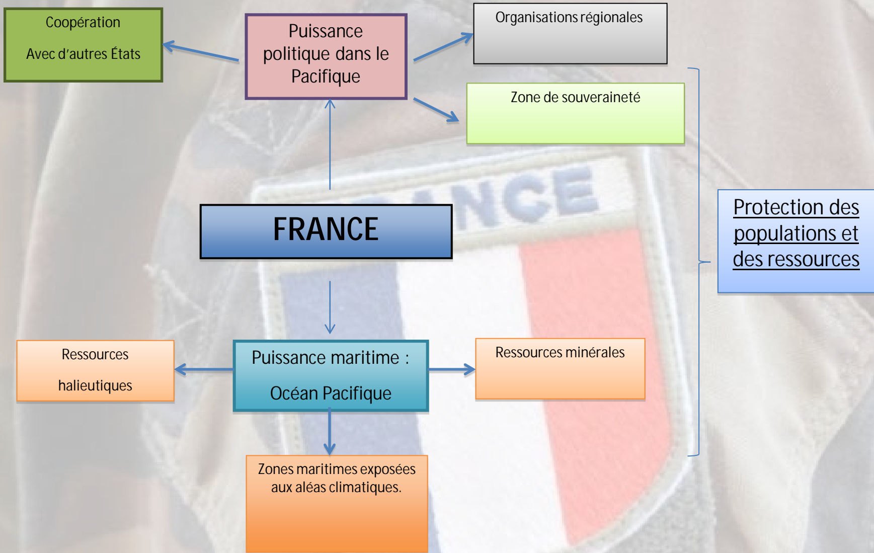
Schéma mental présentant la présence et les actions de la France dans le Pacifique