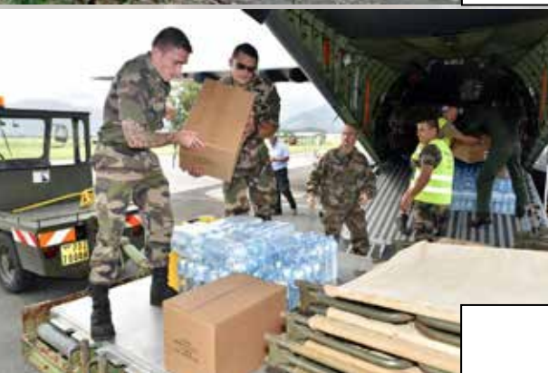
Intervention de l'armée française après le passage du cyclone PAM au Vanuatu, mars 2015

Activité 2. Associez à chaque photo ci-dessus le numéro de la mission de l'armée qui lui correspond. Puis indiquez sous l'image le corps d'armée sollicité : Armée de l'Air, Armée de Terre, Marine nationale.