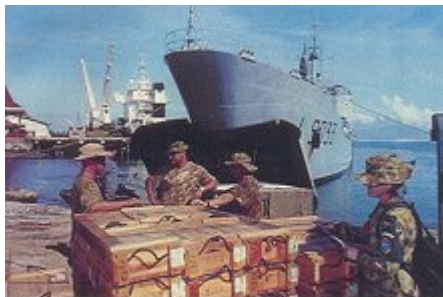
Le Jacques Cartier beuché sur le slip de Dili..

D'après les Nouvelles Calédoniennes du 12/04 /2007