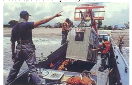
Chargement d'un LCVP avec le fret des soldats canadiens du génie.

vers Dili, capitale du Timor oriental, où il arrive le 2 décembre 1999 avec un premier chargement (matériaux de construction, palettes diverses pour les ONG,...) qu'il déchargera le lendemain, avant de repartir dans la soirée vers Darwin. Au 2ème passage à Dili, les marins du Jacques Cartier découvrent la ville et ses maisons détruites. Les pluies abondantes ayant endommagé les routes, le Batral est sollicité pour effectuer un transport de Dili à Suai, sur la côte sud de l'île. Le débarquement s'effectuera par LCVP. Pour le retour vers Darwin, un groupe de soldats canadiens et leur matériel embarqueront à bord. Noël à Darwin au mouillage, puis le nouvel an à quai. Le 12 janvier 2000 au plan incliné du port de Dili, ultime étape du périple, le Batral embarque les derniers véhicules et matériels du détachement de l'armée de terre déployé au Timor oriental. C'est la fin de l'engagement français dans cette opération. Deux semaines plus tard, le 26 janvier au matin, et après avoir fait une escale de ravitaillement à Cairns, le Jacques Cartier retrouvait la Nouvelle-Calédonie.