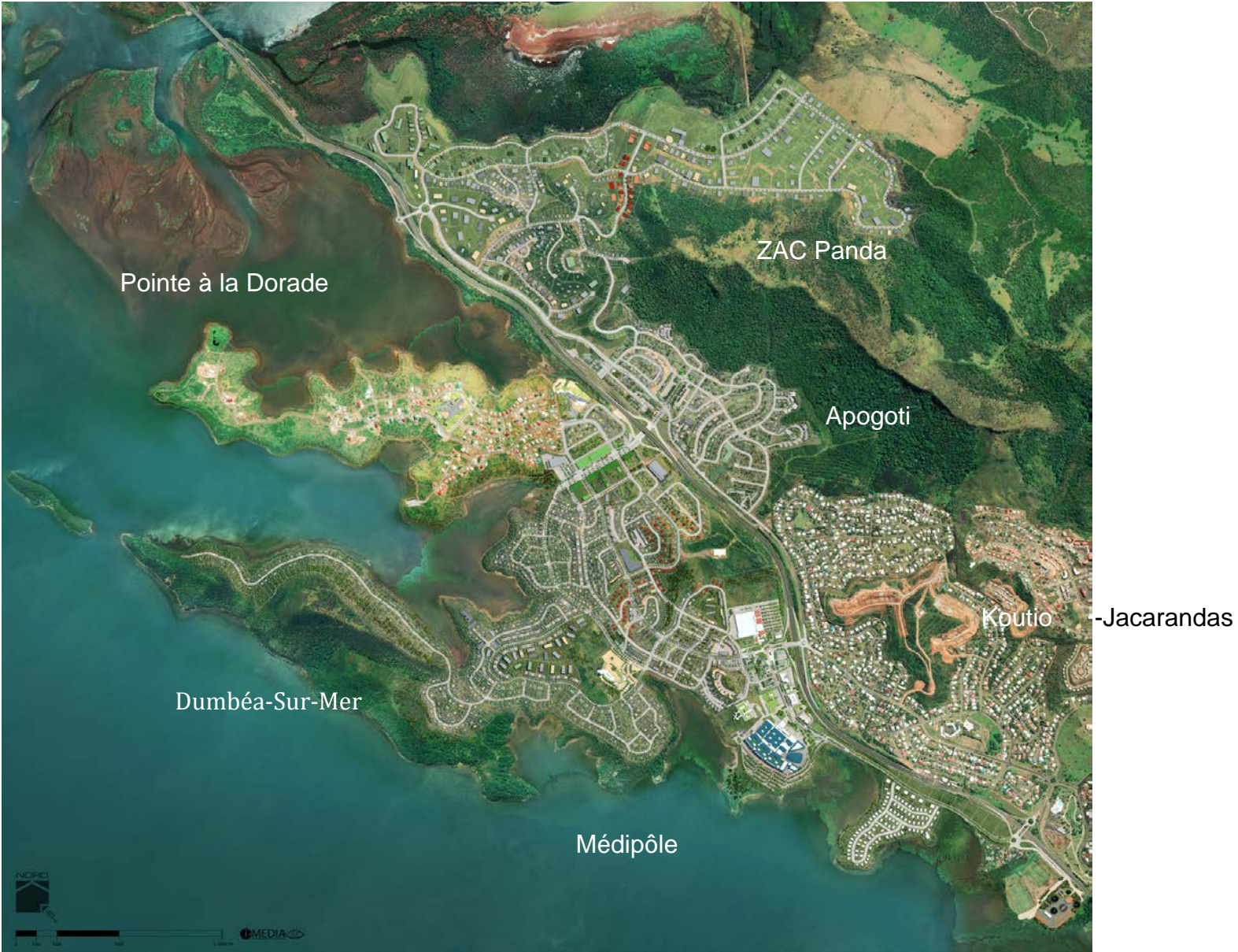
Document 3 : L'extension urbaine de Dumbéa ( https://www.dumbeasurmer.nc/content/decouvrir-dumbea-sur-mer )