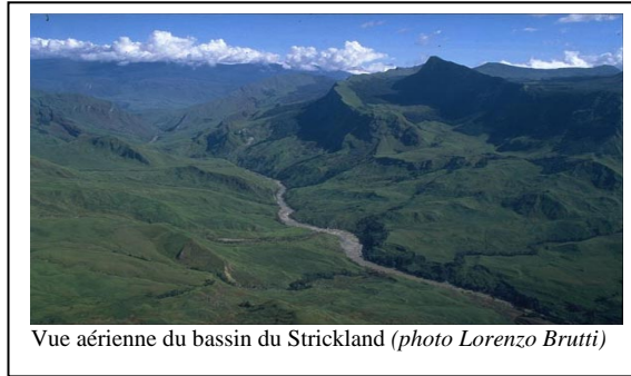
Vue aérienne du bassin du Strickland