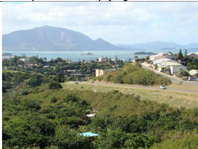
Vue photographique prise rue Teissandier De Laubarede-Nouméa