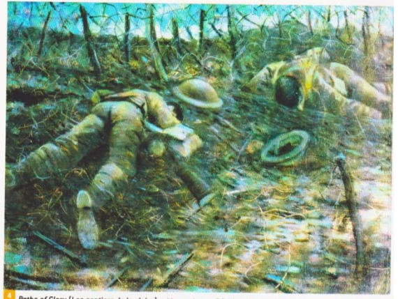
4. Paths of Glory (Les sentiers de la gloire) , tableau peint par C.R.W. Nevinson, 1917. Durant la bataille de la Somme (juillet-novembre 1916), 1 million de soldats meurent en 140 jours (moyenne : 7 142 par jour). Durant celle de Verdun (février-décembre 1916), 300 000 victimes en 300 jours (1 000 par jour). Par comparaison, les guerres napoléoniennes ont tué 700 000 soldats français durant 4 745 jours (moyenne : 147 par jour).

Extrait du manuel scolaire, sous la direction de É. Chaudron et R. Knafou, Belin, 2009