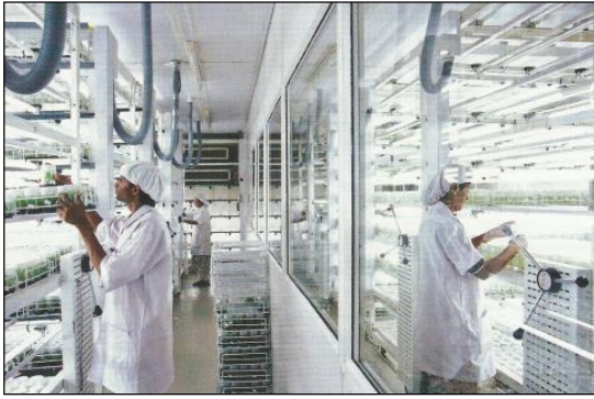
Clonage de plantes et recherche génétique dans un laboratoire de New Delhi en 1997.