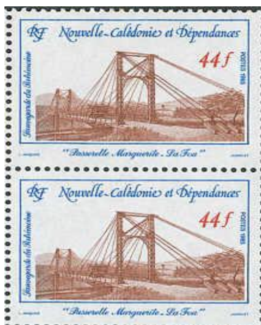
Timbres de la Passerelle Marguerite

Ne pouvant plus supporter de charges importantes, elle est désaffectée après trente années de service. Inscrite sur la liste des Monuments historiques en 1984, elle est restaurée en 1998. L'accès au village se fait actuellement par le pont de La Foa construit sur le côté ouest de la passerelle.