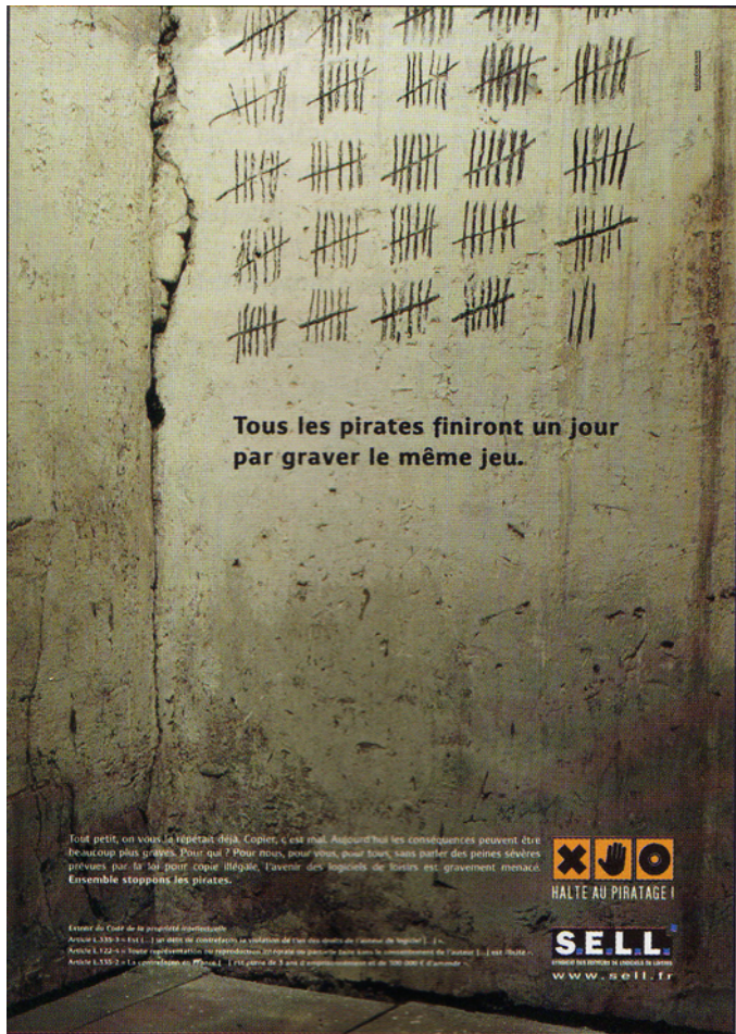
Affiche éditée par le Syndicat des éditeurs de logiciels de loisirs, 2004.

Texte situé en bas de l'affiche : extrait du code de la propriété intellectuelle.