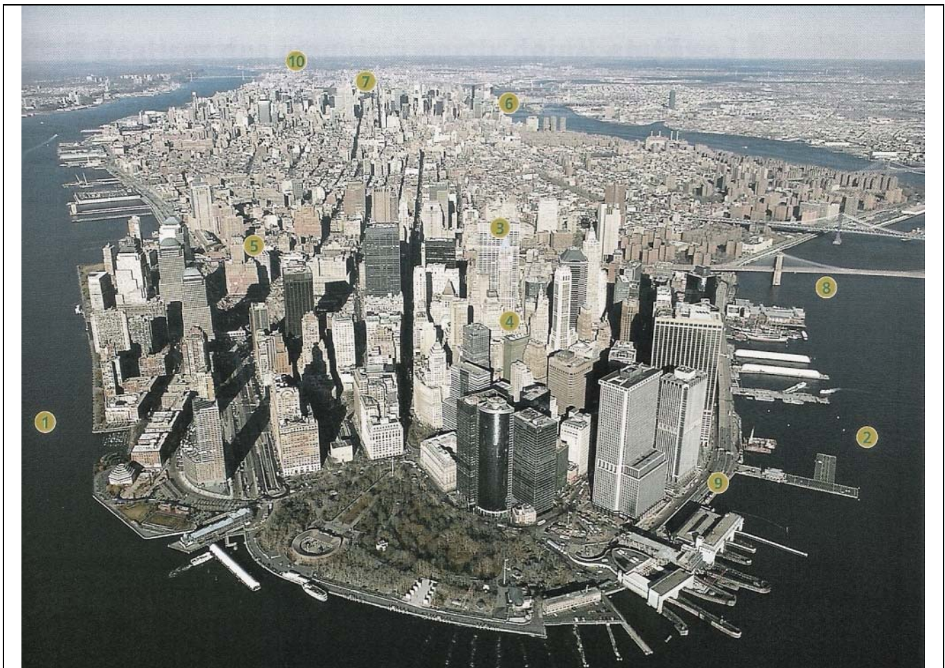
1. Hudson River 2. East River 3. Chase Manhattan Bank 4. Wall Street 5. Ground zero : emplacement des tours du World Trade Center 6. Siège de l'ONU 7. Rockefeller Center 8. Pont de Brooklyn 9. Autoroute urbaine 10. Central Park