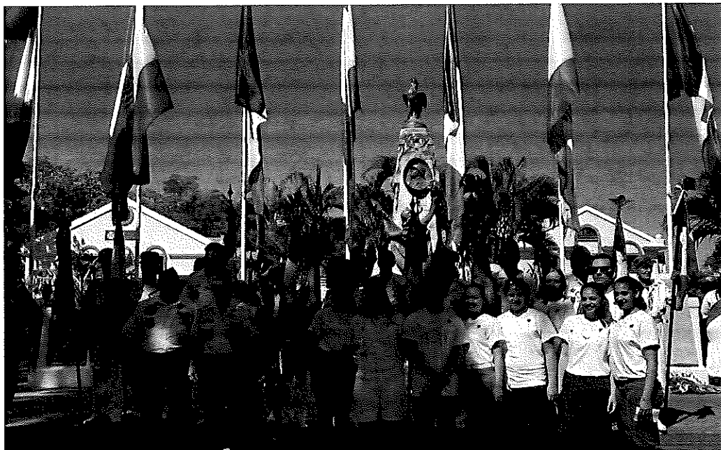
Cérémonie du 11 novembre 2018 : Monument aux morts de Papeete

Document 2 : 11 novembre 2018 : le centenaire de l'armistice de la Grande Guerre