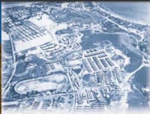
Presqu'île sud de Nouméa

Avec ses 11 000 habitants, la population de Nouméa triple en accueillant 27 000 hommes de plus. L'armée US aménage des réseaux d'égouts, des lignes électriques et accroît le circuit d'eau potable. Des demi-lunes fleurissent dans toute la ville pour protéger hommes et matériel.