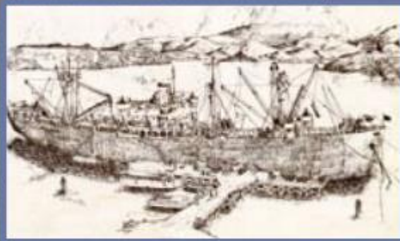
Liberty ship

En octobre 1942, les registres de la capitainerie américaine du port mentionnent la présence de 118 navires, transports et cargos. Pendant quelques mois, Nouméa devient le second port du Pacifique après San Francisco. Début 1943, six cuirassés transitent par Nouméa. Seuls les cargos peuvent accoster. Tout le matériel indispensable à l'approvisionnement des troupes engagées sur le front part de Nouméa d'où l'intense activité portuaire. L'acheminement du ravitaillement vers la Nouvelle-Calédonie est l'affaire des Liberty Ship conçus pour les besoins de la guerre. Leur fabrication à plus de 2500 exemplaires est l'occasion d'une révolution dans la technique de construction.