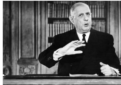
5- Élection du président au suffrage universel direct