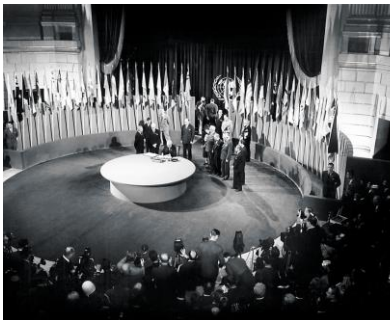
4- La création de l'ONU