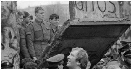
1- La chute du mur de Berlin

1. Situez les événements sur la frise chronologique ci-dessous, en reportant le numéro correspondant dans la case.