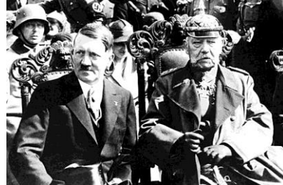
2- L'arrivée au pouvoir d'Hitler