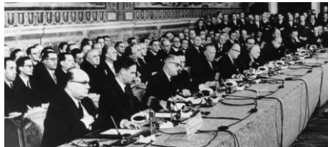
3- Le traité de Rome