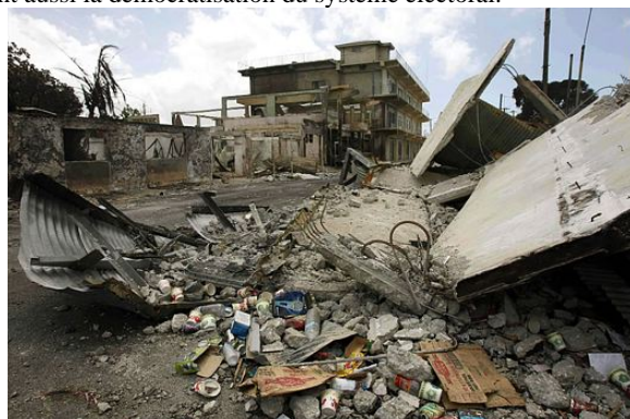
La capitale dévastée à 80 % après les émeutes

D'après un article de Wikipedia sur Tonga