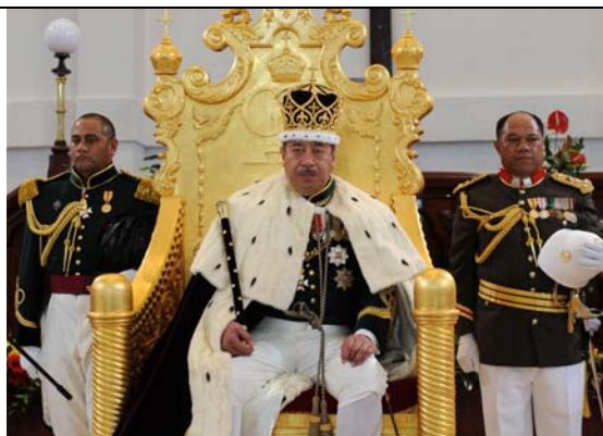
Le couronnement de Tupou V, le 1 er août 2008. Les fastes de la monarchie dans un pays très pauvre.

La constitution de Tonga date de 1875. Elle repose en théorie sur le principe d'une monarchie constitutionnelle. L'exécutif est aux mains de la famille royale, qui nomme le « cabinet » et les gouverneurs de Ha'apai et de Vava'u. Le Premier ministre est le fils du roi. Le Parlement est monocaméral. Il est composé de 30 membres, soit les 12 nobles membres du cabinet, 9 nobles élus par les 33 familles nobles du pays et 9 représentants élus par le peuple... Le pouvoir judiciaire est aux mains du roi... Aujourd'hui, Tonga est à un tournant de son histoire dans la mesure où le mouvement pour la démocratie dans ce pays est en train de gagner les couches populaires de la société tongienne. Celles-ci qui, dans leur ensemble, gardent leur confiance en leur roi, et le respectent, sont plus critiques envers son entourage de nobles qui ne pense qu'à son propre intérêt.