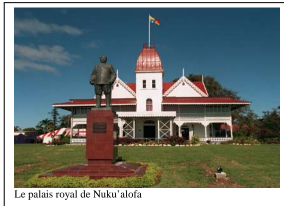
Le palais royal de Nuku'alofa