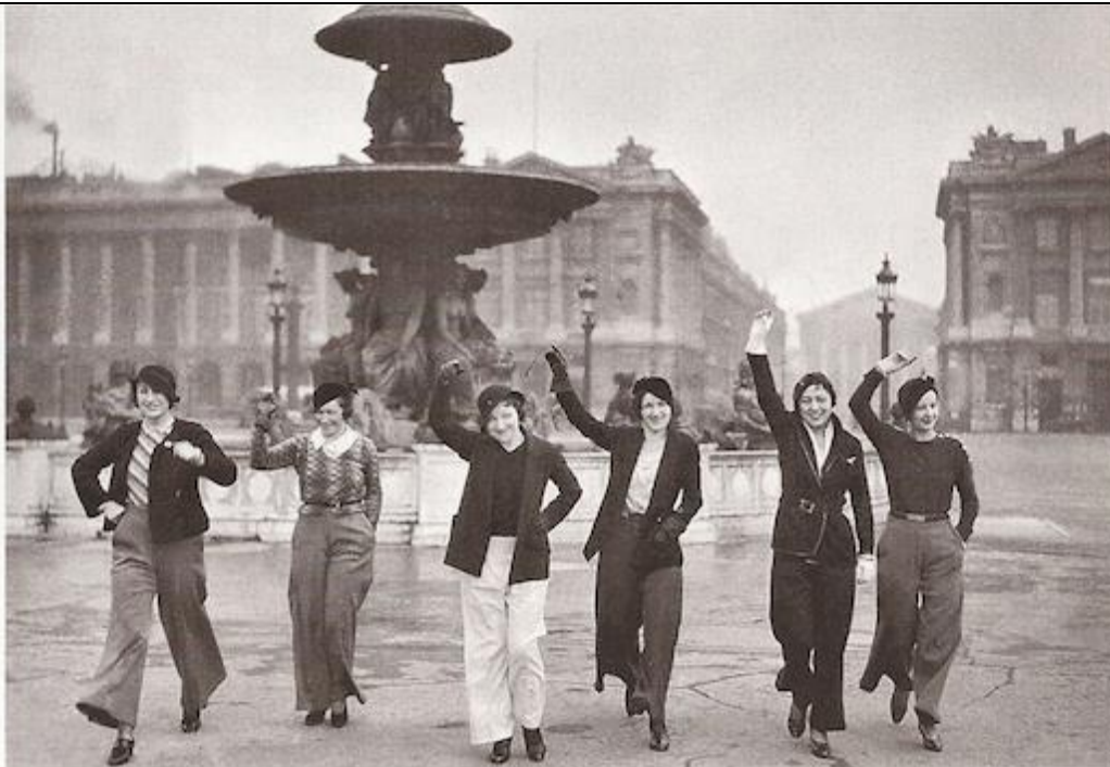
Jeunes parisiennes sur la place de la Concorde en 1933

Consigne : après avoir présenté le document, expliquez que le port du pantalon est révélateur de l'évolution de la mode et de l'image des femmes durant l'entre-deux-guerres.