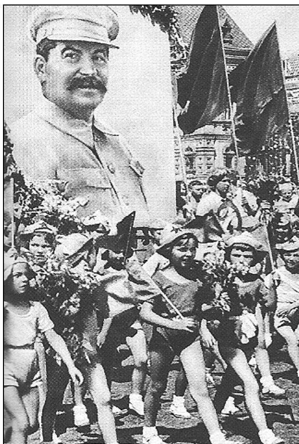
(Photographie de 1936).

Document 1. Parade des Pionniers, jeunes de 9 à 15 ans membres d'une organisation de jeunesse stalinienne.