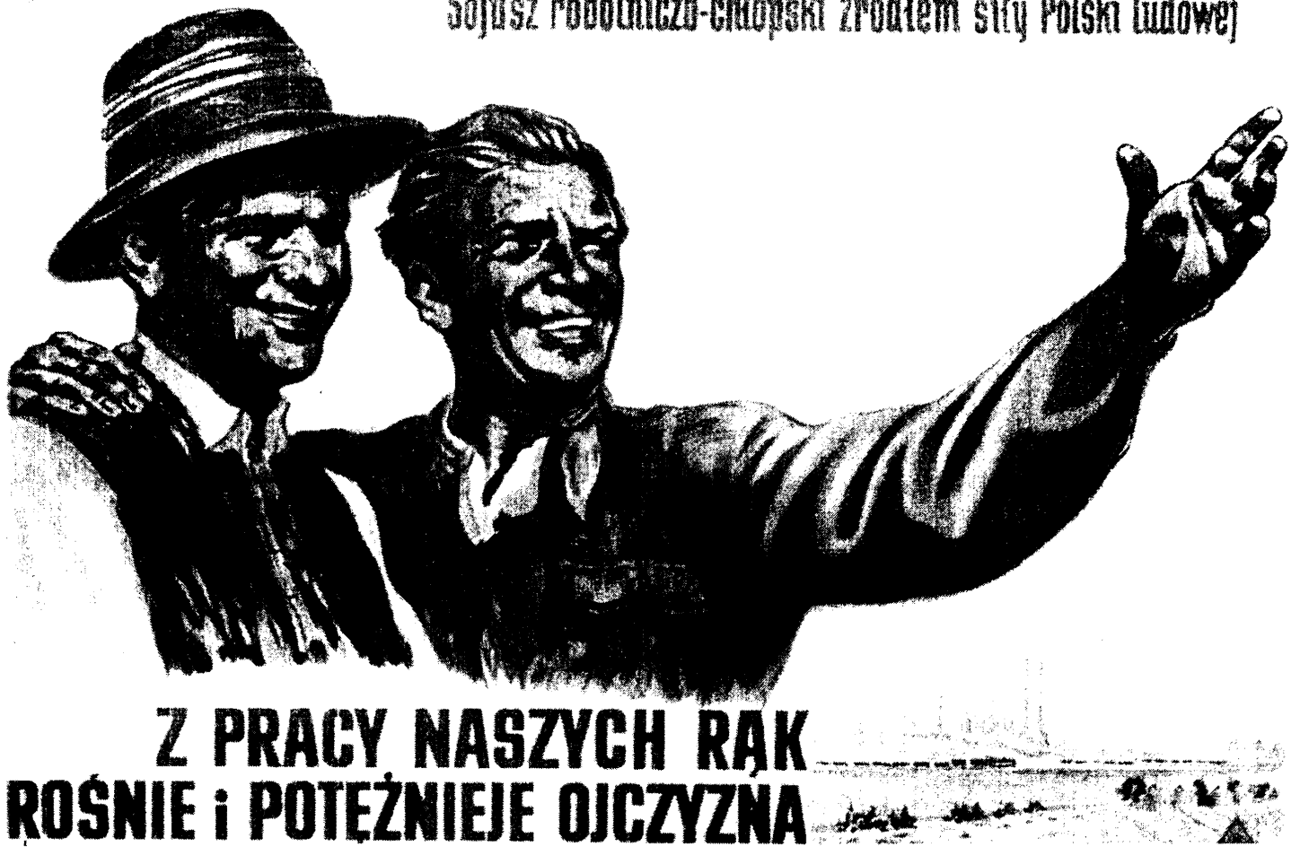
Affiche de Lucjan Jagodzinski, 1953, musée de l'affiche de Wilanow, Varsovie

Sojusz robotniczo-chłopski źródłem siły Polski ludowej