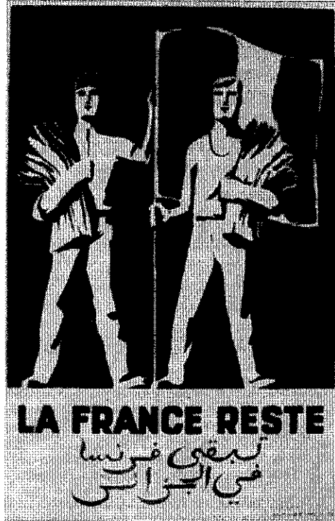
(le drapeau est bleu, blanc, rouge dans l'affiche originelle) Affiche reprise dans L'Histoire , n°292, novembre 2004