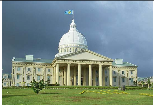
Le Capitole de Melekeok. L'influence des États-Unis...