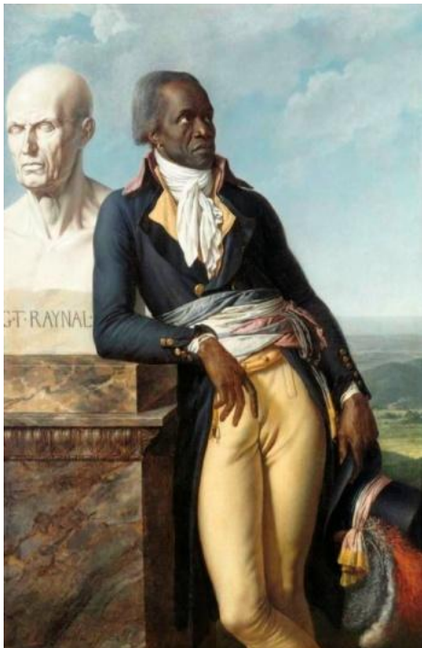
Portrait du citoyen Belley Girodet 1797 Château de Versailles.