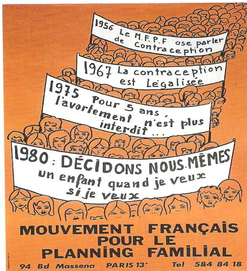
Affiche du MFPF (Mouvement français pour le planning familial), 1975.