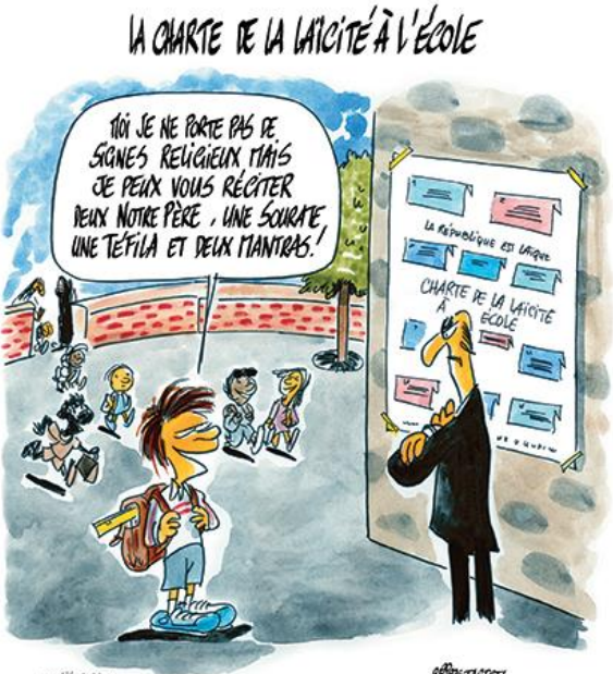
L'apparence religieuse est interdite à l'école Philippe Tastet, dessinateur de presse

1. Décrire les caricatures (personnages, lieu, objets, action représentée).